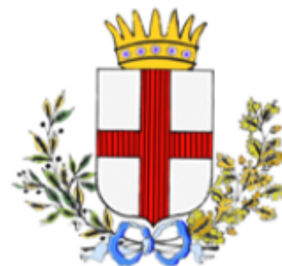
Comune di Sant'Angelo in Vado