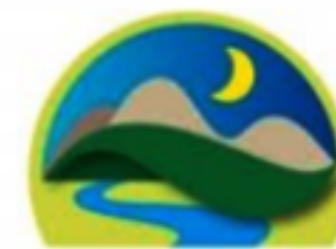
Alta Valle del Metauro Unione Montana